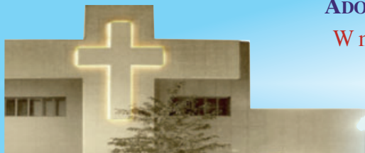
Jezuicki Ośrodek Milenijny

W pierwszy piątek miesiąca - od 17:30 do 19:30